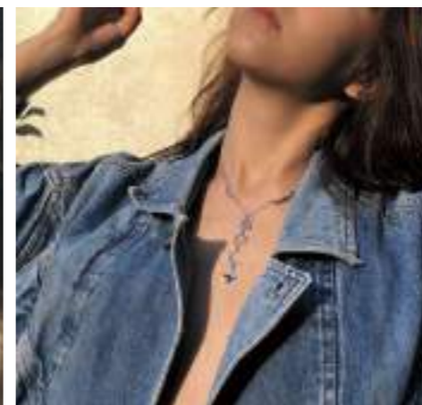
© @litoraxx / Création Fadia Otte